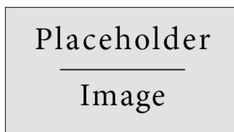
Figure 3.1: Figure caption