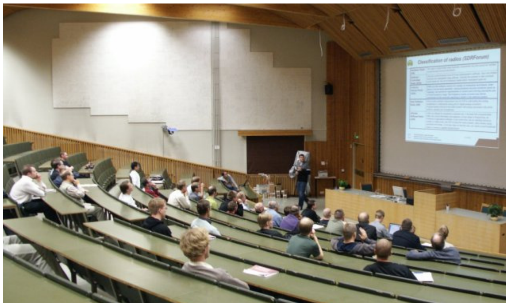
Figure B1: Kuvateksti, jossa on liitteen numerointi

Liitteissä voi myös olla kuvia, jotka eivät sovi leipätekstin joukkoon: Liitteiden