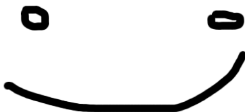
Rysunek 3.1: Opis do obrazka.

Obrazki wstawiany do dokumentu za pośrednictwem sekcji figure . Przykładowy wyśrodkowany rysunek z etykietą i opisem to Rys. 3.1.