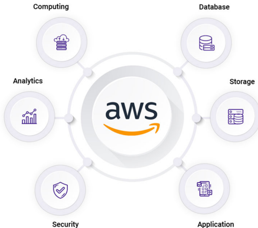
Σχήμα 1.1: Σχήμα AmazonCloud

Η PaaS παρέχει ένα πλήρες περιβάλλον ανάπτυξης και αναπτύξεως, συμπεριλαμβανομένου του χρόνου εκτέλεσης, ενδιάμεσου λογισμικού, βάσεων δεδομένων και εργαλείων ανάπτυξης, επιτρέποντας στους προγραμματιστές να χτίσουν, να δοκιμάσουν και να αναπτύξουν εφαρμογές πιο αποδοτικά χωρίς να διαχειρίζονται την υποκείμενη υποδομή.