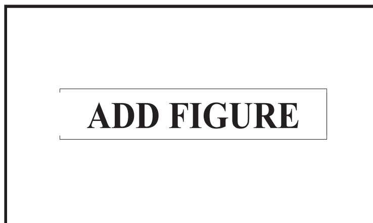
Figure 3.1: Example of figure added from a chapter directory