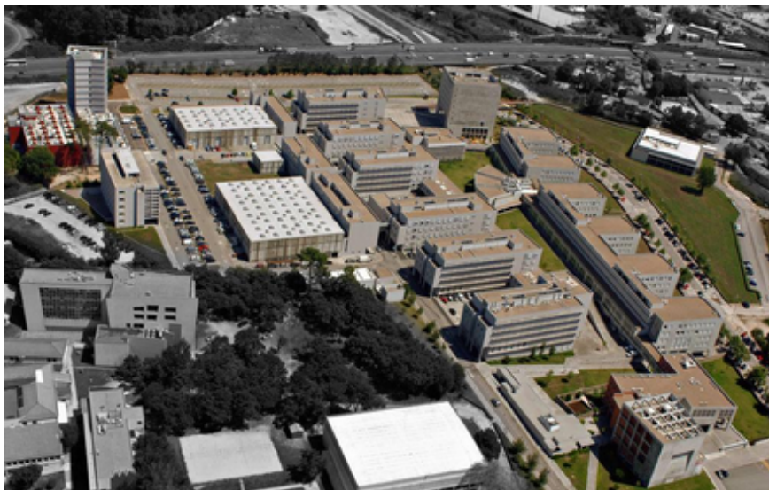
Figura 1.1: Fotografia aérea do Campus da FEUP.

faucibus. Morbi dolor nulla, malesuada eu, pulvinar at, mollis ac, nulla. Curabitur auctor semper nulla. Donec varius orci eget risus. Duis nibh mi, congue eu, accumsan eleifend, sagittis quis, diam. Duis eget orci sit amet orci dignissim rutrum.