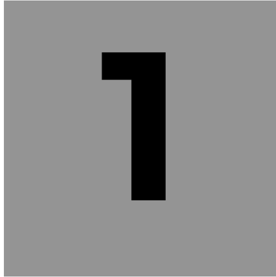
Figura 1.1: Imagen