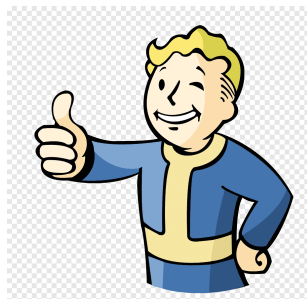
Figura 3.1. Vault Boy approves that

En definitiva, la imagen (figura 3.1) se mostrará con un ancho igual al 25% del ancho que ocupa el texto, centrada, con un pie de foto y una etiqueta para referenciar.