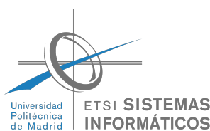
Figura A.3. Logo de la ETSISI utilizado en la cubierta trasera de la memoria

La ETSISI tiene configurados como colores principal y de link el RGB (0, 177, 230). El logo es el mostrado la figura A.3 .