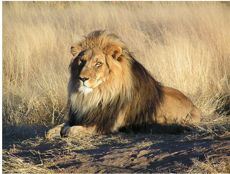
Abbildung 2: Ein Bild von einem Löwen. Bild übernommen von Referenz [12].

Abbildung 2 zeigt wie eine Abbildung in der Gleitumgebung figure eingefügt werden kann. Die Optionen [htb!] definieren wie die Abbildung platziert werden soll. Abbildung 3 zeigt ein Bei-